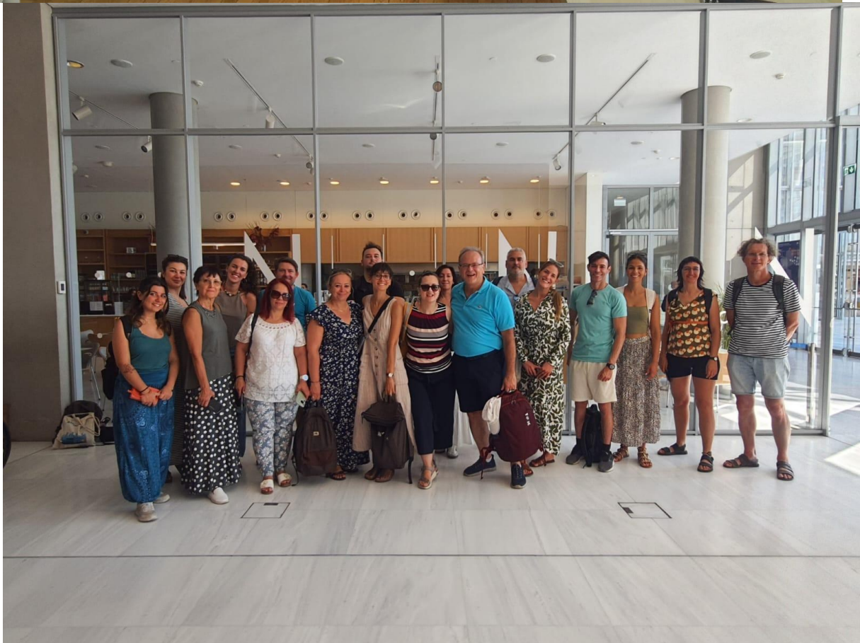
Se spolužáky ve Stavros Niarchos foundation