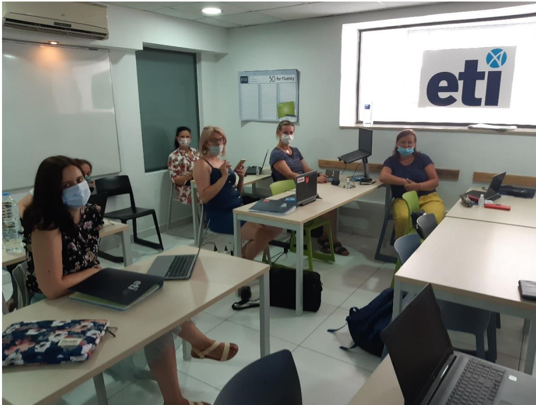
Při prezenční výuce ve škole ETI