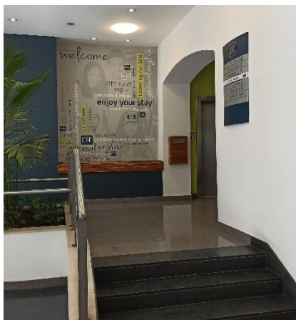
ETI vstupní hala