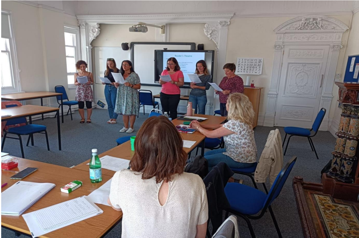
Theatreading – presentace