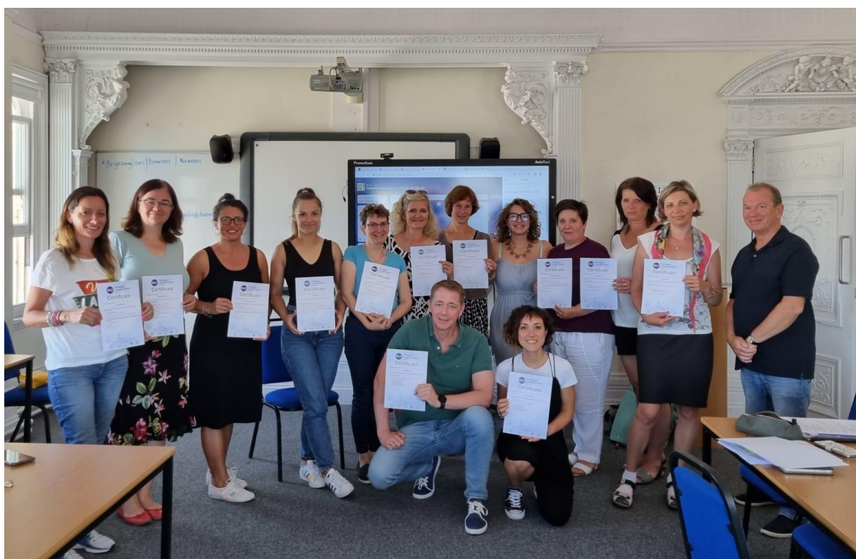
Kolegyně v mém kurzu a certifikáty, které jsme obdrželi na jeho závěru

Jsem velice spokojená se samotným kurzem, který opravdu splnil, ne-li ,předčil moje očekávání, rovněž i s hostitelskou rodinou, se kterou jsme se spřátelili a jsme v kontaktu. Do budoucna bych se ráda znovu zúčastnila podobného kurzu, protože sama na sobě pozoruji velký pokrok a chuť do další práce, kterou mi tento kurz dal.